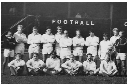
AAC bij Bristol RFC

We gingen met veertig man naar Bristol. Verzamelen in de kroeg van een van de clubleden, met de bus naar Hoek van Holland, stukje met de boot en dan nog een pokkenend met dezelfde bus naar Bristol, want die bus ging mee op de boot. Volgens mij bestond de Europese Unie nog niet eens, want er was nog paspoortcontrole voordat we de boot opgingen. Maar dat kon ook verzonnen zijn om het verhaal te romantiseren. Hoe dan ook, we stonden in een rij toen de club oudste voor het eerst op zijn toeter blies. Nu moet je weten dat we vooraf, in die kroeg voordat we vertrokken, de cluboudste een toeter in de handen hadden gedrukt. Als hij gedurende de trip drie keer zou claxonneren moest iedereen met zijn handen en voeten van de grond. De laatste moest vijf gulden (zo oud zijn we) deponeren in de pot. Je moest goed opletten want als je met twee keer toeteren op je rug ging liggen moest je ook dokken. Het ging om drie keer.